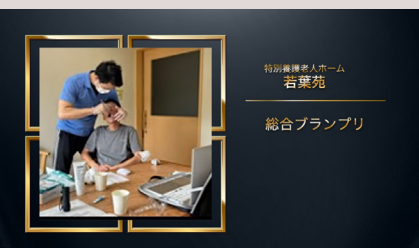
特別養護老人ホーム 若葉苑 総合プランプリ